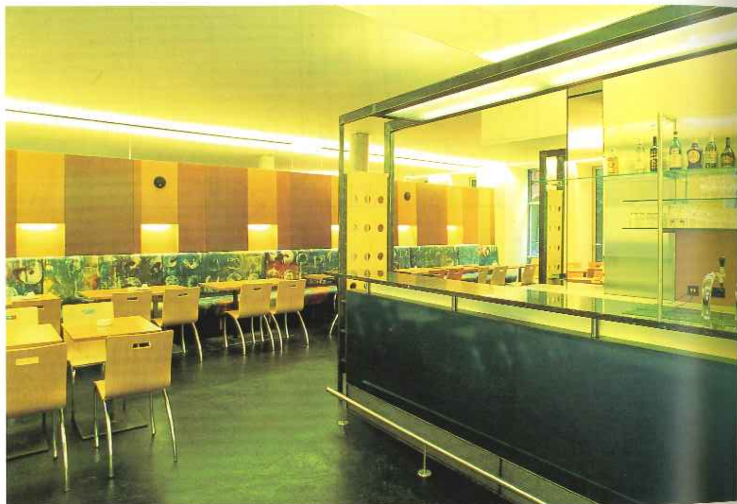
Above: View of restaurant area. The bar counter front panel is finished blue metallic varnished fiberboard. Opposite: View of entrance.

上：レストランの方向を見る。カウンター下部の板は樹脂板、ブルー・メタリック光沢仕上。光によって表情を変える。右頁：入口方向を見る。